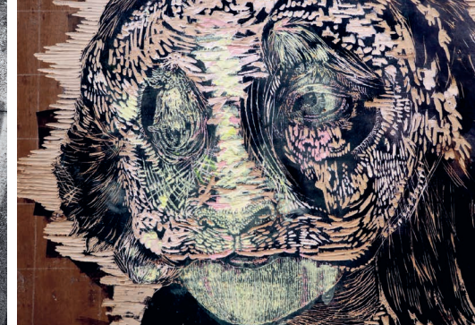
Lapine (detalle), relieve y tintas litográficas sobre madera, 2017, 142 x 119 cm. © Jean Picon.