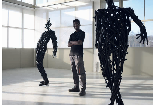
Nkrononkronon, acrílico sobre asamblea de madera, 195 x 65 x 60 cm, 210 x 60 x 55 cm, 2019. (Cortesía de Assoukrou Aké - Crédito: Charlie Caniveng). © Adagg, París, 2023.