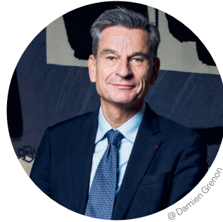
Hervé LEMOINE Director del Mobilier National

De las obras de Picasso a las de Miró, la relación franco-española en el ámbito de la artesanía se hace evidente. Estas figuras emblemáticas, cuyas creaciones han sido magnificadas por el Mobilier National, subrayan la profundidad de nuestros intercambios artísticos y la intensidad de nuestra cooperación.