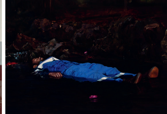
Sans Titre, óleo sobre lienzo sur toile, 160 x 200 cm., 2022.