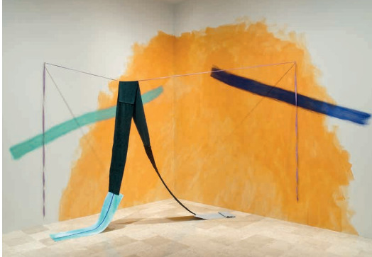
Ancrajes (Anchages), instalación, 250 x 250 x 200 cm, pinturas textiles, cinta et pintura mural. © Irwin Leullier © Adago, París, 2023.