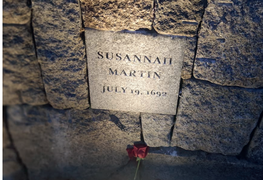
El-Fegoun, « Witch », Salem-Massachusetts, USA, 2022.