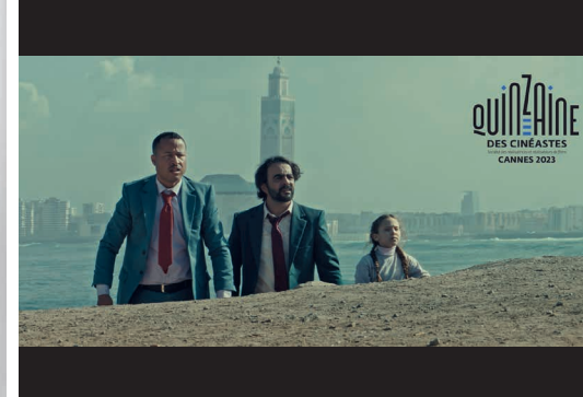
Póster de la película Désert , 2023.