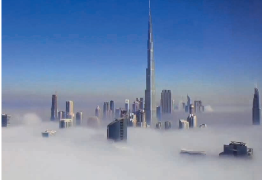
La poésie nous revient de là où on ne l'attendait plus, película, 2017.