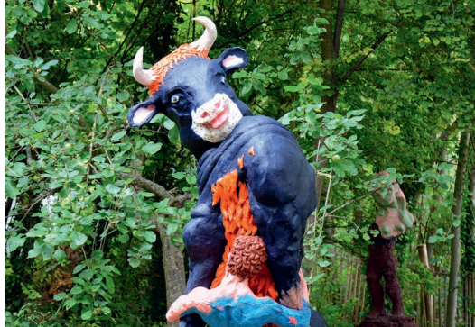
Thesee et le minotaure (detalle), yeso, espuma expansible, metal, 230 x 120 x 130 cm, 2023.