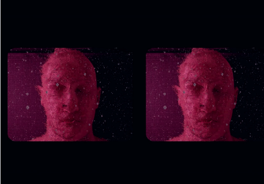
For here am I sitting in a tin can far above the world, 2023.