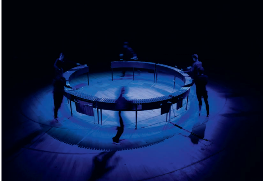
Creación de los Métamorphoses en el auditorio de Radio France.