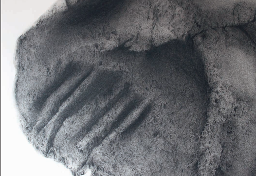
Inhumación I, 100 x 70cm., carboncillo y lápiz compuesto, 2021.

Artista becada por el Ajuntament de la Ciutat de València