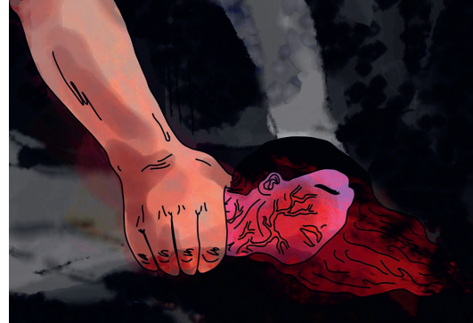
Bras et front veinés , dibujo digital, dimensiones variables, 2023.