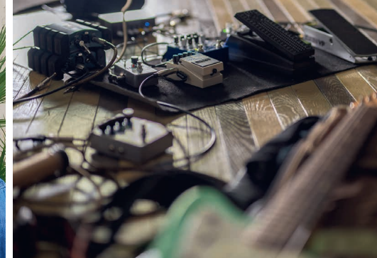
Setup para Nepenthes .